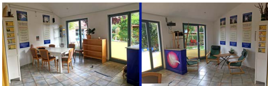
Der Gartenraum im „Normal-Zustand“

Im Sommer wird auch gern im Laubengang geschlafen.