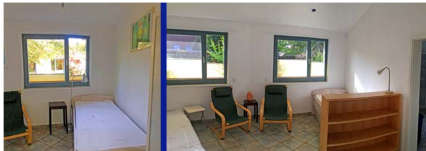
Ost- und Westzimmer im „Roh-Zustand“